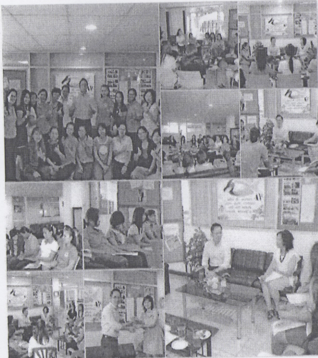
การแก้ปัญหาอย่างสร้างสรรค์