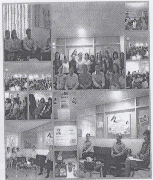
“ทำงานอย่างใกล้ชิดทั้งภายในและภายนอก”