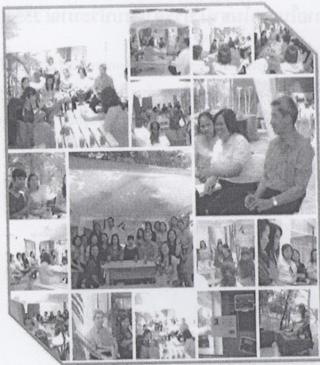
“ทำงานอย่างจริงจัง”